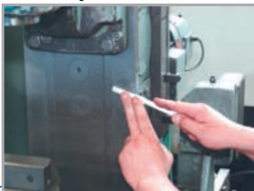
Retouche de glissière de machine

Le mélange parfaitement équilibré des grains céramiques et du liant caoutchouc permet d'éviter les problèmes de bourrage et d'encrassement. Ces abrasifs peuvent travailler aussi bien à sec que sous lubrification.