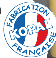
CM 200 TRONIC AZ-094

Motor con variador electrónico integrado con mando manual para moleta dentada.