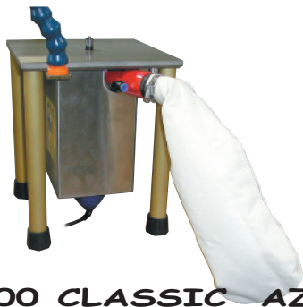
CM 200 CLASSIC AZ-092

Motor de variador electrónico con mando en el pie.