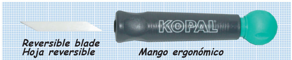
Reversible blade Hoja reversible